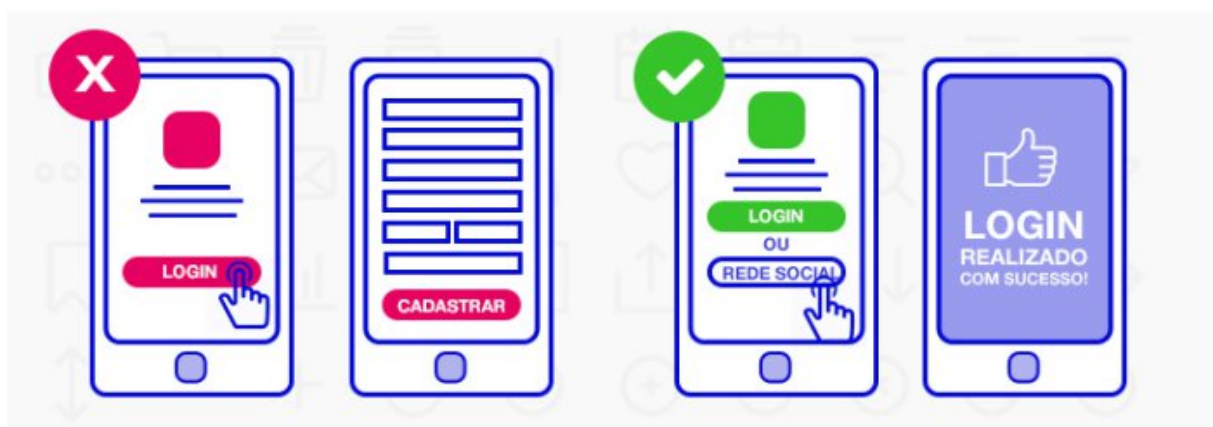
Figura 2 - Aplicando o UX